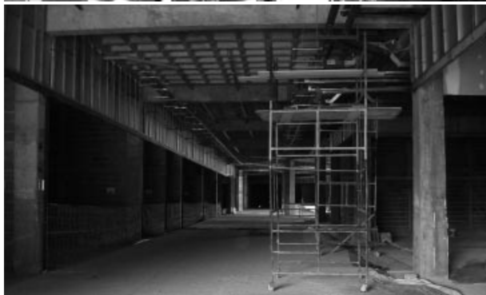
Os incentivos concedidos pelo município atraem novos empreendimentos para Imperatriz